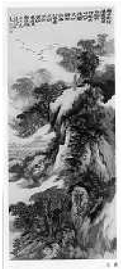
Gb. Self dan Alam (Taoist Painting)

Kalau dalam konsep sosialisme , Self ditekan dan harus tunduk pada kepentingan komunal, sedangkan dalam konsep kapitalisme/ liberalisme , Self terlalu diagungkan, maka dalam Konfusianisme ditempatkan sebagai pusat namun sekaligus sadar merupakan bagian kecil dari alam semesta. Keagungan manusia justeru muncul setelah dia menyadari hanya merupakan bagian kecil dari keseluruhan ( kosmos ).