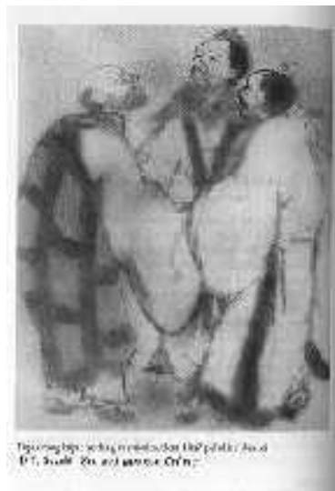
Gb. Orang Bijak Ketawa