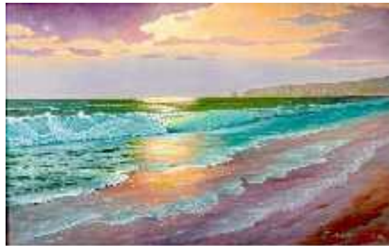
Gb. Laut (Lukisan Daoed Joesoef)

Menjadi besar adalah peristiwa alamiah dan tidak ada yang perlu disalahkan. Nature, yang diciptakan oleh Tuhan, mengajar bahwa semakin besar bukan menjadi bahaya bagi yang lain, malah sebaliknya memberikan ruang hidup bagi yang lain sehingga terjadilah keindahan dalam keanekaragaman, bukan menyeragamkan. Tantangan peradaban adalah dapatkah kultur buatan manusia bisa mengikuti nature ?