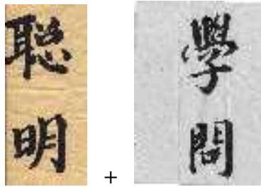
Gb. Pintar + Ilmu Pengetahuan

Selain itu ada juga kata ' Shang – tie / Raja dari langit ' namun tidak pernah dipakai oleh Konfusius karena lebih memberikan penekanan pada sifat transenden top-down yang berbeda dengan konsep ' Tian ' yang lebih memberikan limit pada upaya Self Cultivation sesuai dengan pengertian bahwa setiap hal yang mempunyai awal pasti mempunyai ujung.