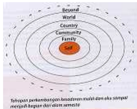
Gb. Perkembangan Self

Self is not as isolated atom, Self is not a single, separate individuality Self as a being of relationship Self as center of relationship Self develops continuously Ever expanding process Ever growing network of human relatedness A truly Self Realization