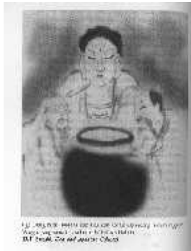
Gb. Lukisan ' Tiga Orang Bijak Minum Anggur '

Zen master Hakuin ( 1685 - 1768 ) membuat lukisan 3 (tiga) orang bijak sedang minum anggur disertai kaligrafi di sampingnya ' Anggur yang samapun dirasakan berbeda oleh Tiga Orang Bijak “.